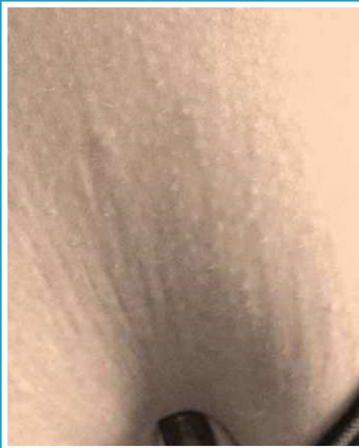
PRIMA DEL TRATTAMENTO