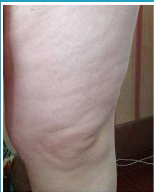
PRIMA DEL TRATTAMENTO