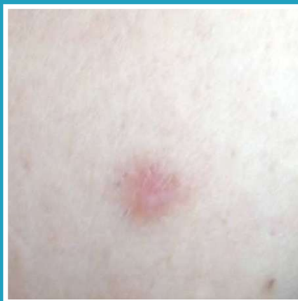
DOPO 15 BAGNI