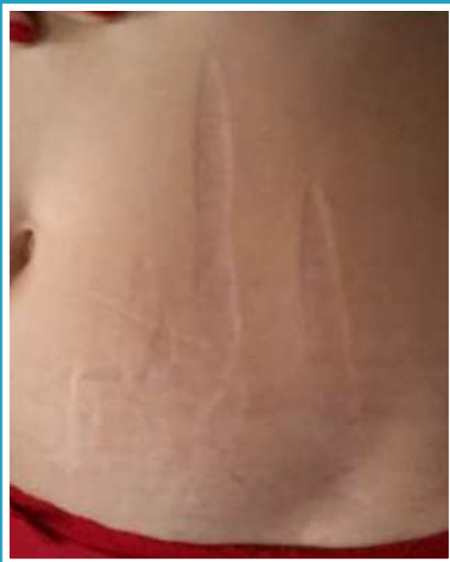
PRIMA DEL TRATTAMENTO