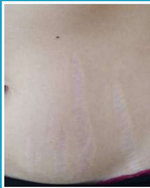
DOPO 15 BAGNI