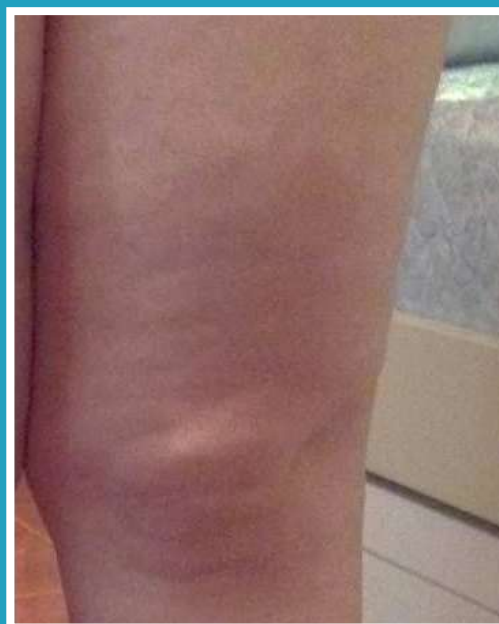
DOPO 15 BAGNI