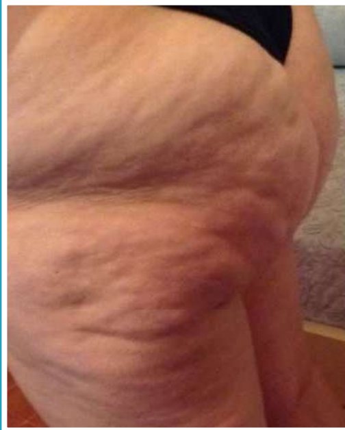
PRIMA DEL TRATTAMENTO