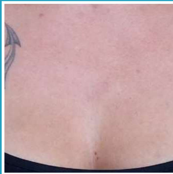
DOPO 15 BAGNI