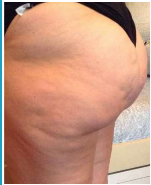
DOPO 15 BAGNI