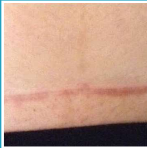
DOPO 15 BAGNI