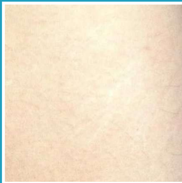
DOPO 15 BAGNI