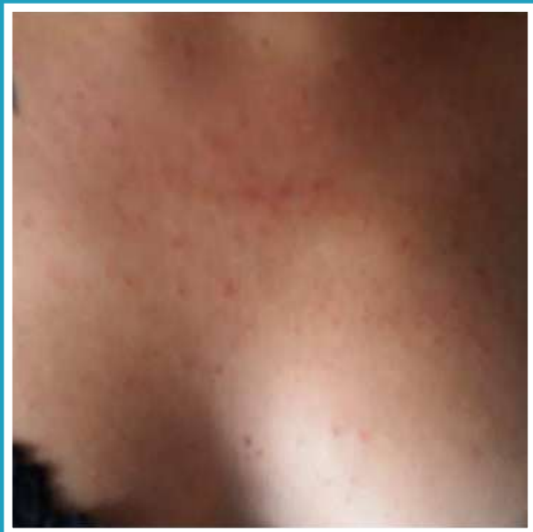
PRIMA DEL TRATTAMENTO