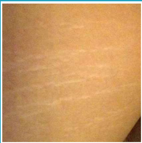
PRIMA DEL TRATTAMENTO